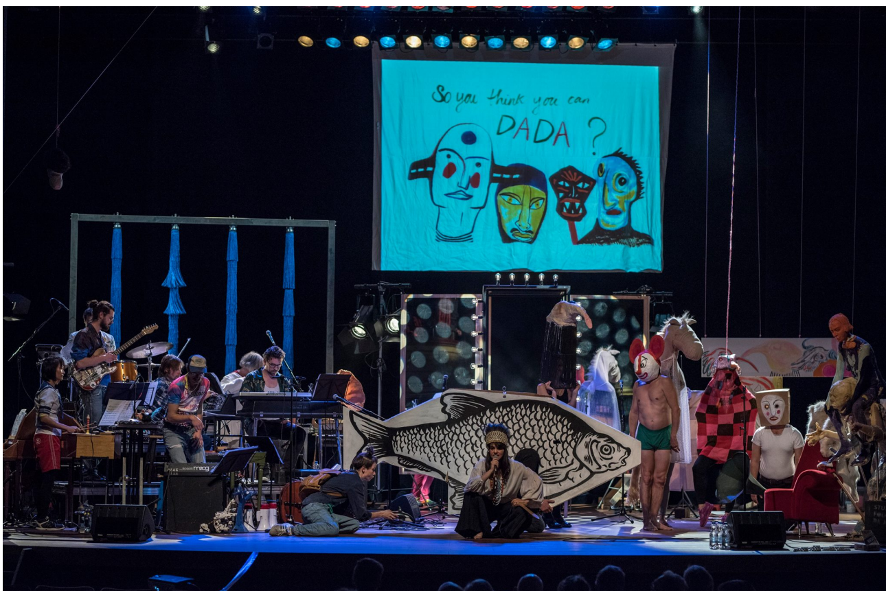
So You Think You Can Dada?!

een muziekcompositie dan van een traditioneel toneelstuk. Vaak vloeit het stuk zelfs binnen een monoloog van realiteit naar realiteit. De montage is associatief, meer begaan met ritme en thematische assonanzen dan met eenheid van tijd en ruimte. Het is eerlijk gezegd een openbaring om als toeschouwer zo veel vertrouwen van een maker te krijgen: je kan zelf klemtonen leggen binnen het rijke betekeniskader dat Vos en zijn fenomenale cast en muzikanten schetsen, terwijl je wordt meegevoerd in een stroom die ergens het midden houdt tussen emotionele intuïtie en de rusteloze zwerftocht van een eindeloos nieuwsgierige geest. Ophelia is begoochelend en ontroerend, totaal uniek muziektheater dat veel moois belooft voor de toekomst van de Veenfabriek."