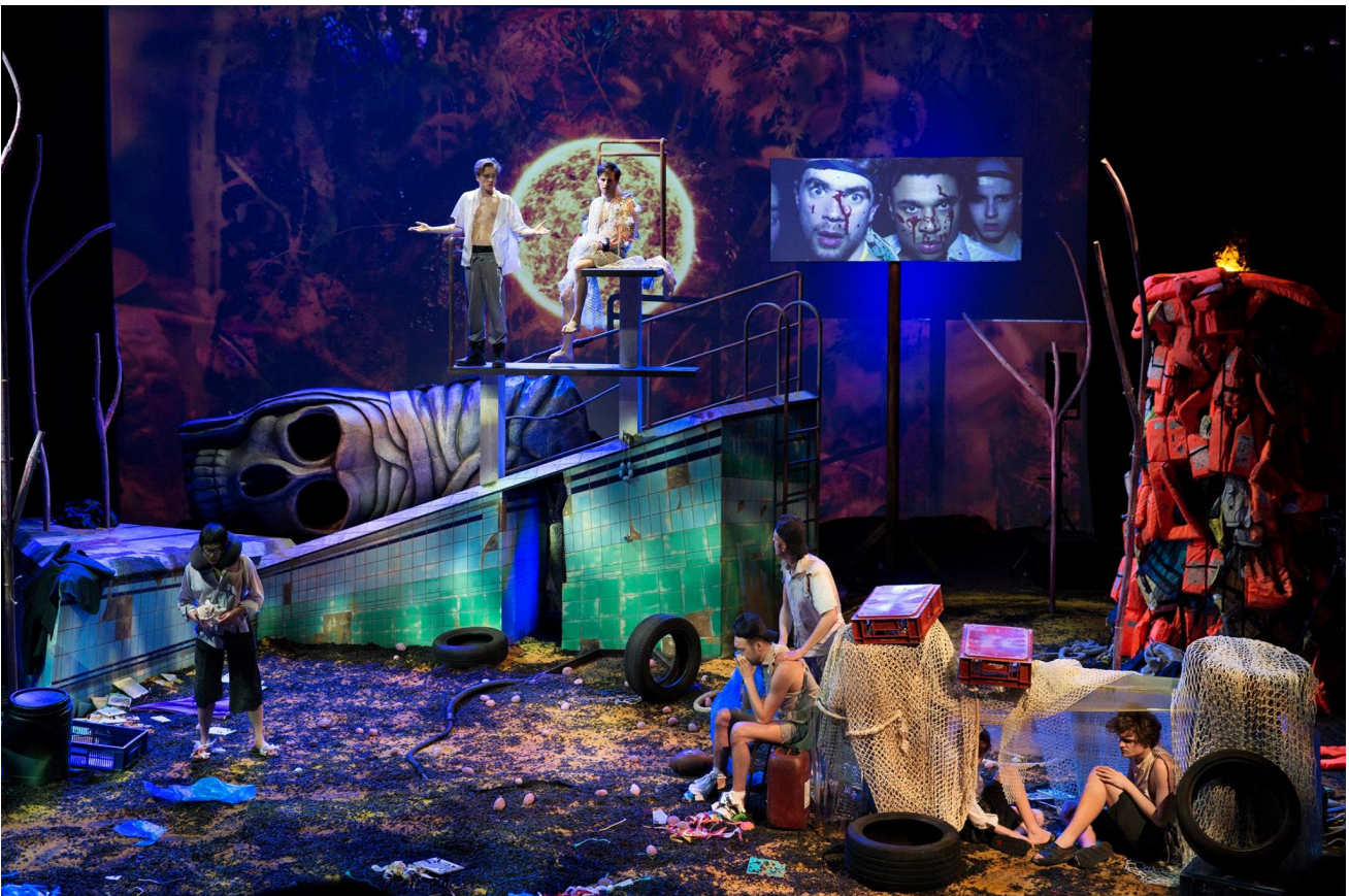
Lord of the Flies van Het Nationale Theater en de Veenfabriek