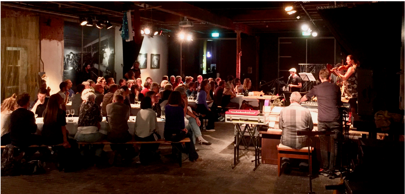
Veenproef Ophelia/seizoensopening | foto: Judy Lijdsman