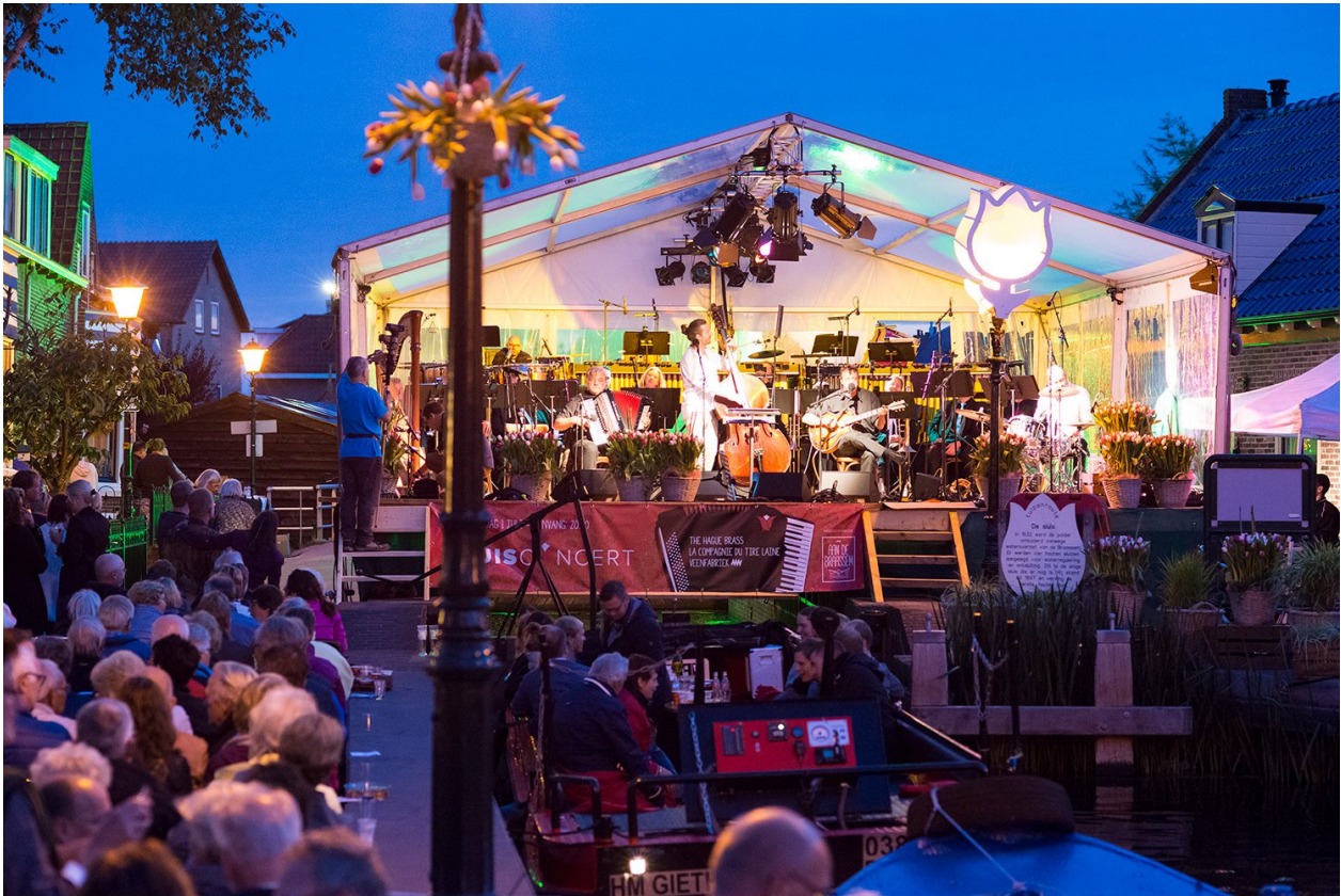
La Compagnie du Tire-Laine en de Veenfabriek spelen op het Sluisconcert Roelofarendsveen