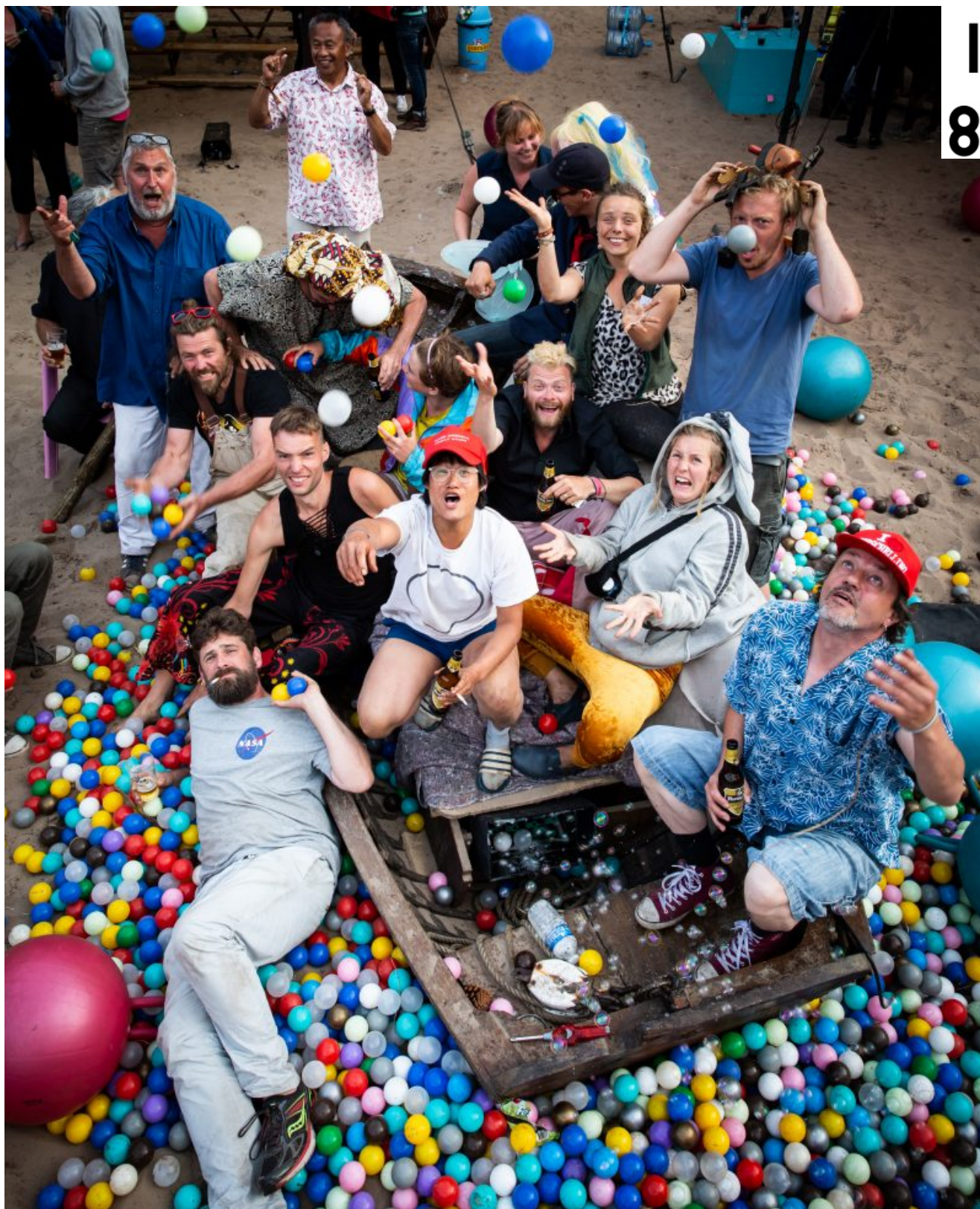
Pinokkio | na de Premiere | foto: Nichon Glerum